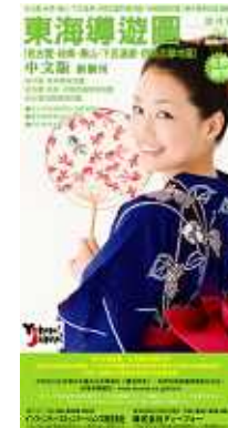
「東海導遊図」中文版 概要

形 状/ A2版・折り加工 (表4C裏4C) 初版発行/ 2009年6月 発行部数/ 10万部 発行期間/ 年4回発行 発 行 日/ 3月末、6月末、9月末、 12月末 発行 設置場所/ 名古屋、その他愛知県 内、岐阜、三重の主要 ホテル・旅館、全日空 (台湾、香港)、台湾・ 香港、他の大手旅行 会社、中部国際空港 案内所、他予定 発 行/ インフィニティ・コミュニ ケーションズ株式会社