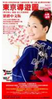
「東京導遊図」繁体中文版概要