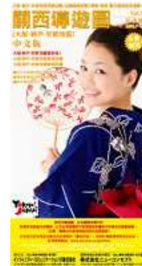
「関西導遊図」中文版 概要

形 状/ A2版・折り加工 (表4C裏4C) 初版発行/ 2008年12月 発行部数/ 12万部 発行期間/ 年4回発行 発 行 日/ 3月末、6月末、9月末、 12月末 発行 設置場所/ 大阪・神戸・京都の主要 ホテル・旅館、全日空 (台湾、香港)、台湾・ 香港、他の大手旅行 会社、関西国際空港 外国人案内所、他 発 行/ インフィニティ・コミュニ ケーションズ株式会社