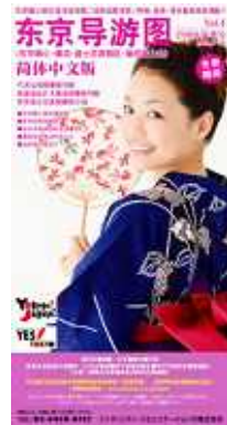
「東京導遊図」簡体中文版概要

形 状/ A2版・折り加工 (表4C / 裏4C) 初版発行/ 2008年9月 発行部数/ 15万部 発行期間/ 年4回発行 発 行 日/ 3月末、6月末、9月末、 12月末 発行 設置場所/ 東京都心主要ホテル・ 旅館、全日空(上海、北 京、杭州、大連、他)、 中国国内大手旅行会社、 成田空港第1・第2ター ミナル外国人案内所、 羽田国際線、他 発 行/ インフィニティ・コミュニ ケーションズ株式会社