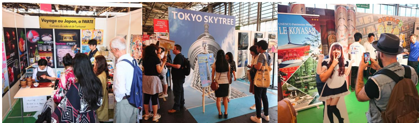
前回迄のJapan Expo開催風景

「2023 Japan Expo -France Paris-」出展をご希望の自治体・企業様は、 次頁よりお申込み下さい。