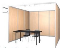
9㎡の基本ブース (3m x 3m)