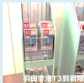
< 設置イメージ >