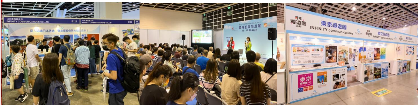
香港ITE “ジャパンTABIゾーン”開催風景

※事前の出展意思表明フォームのご提出により、確保すべき小間数を主催者と共有します。事前意思表明が無くとも、小間が有ればお申込は可能ですが、良い小間位置が確保できない可能性が有りますので、出展事前意思表明フォームのご提出にご協力下さい。