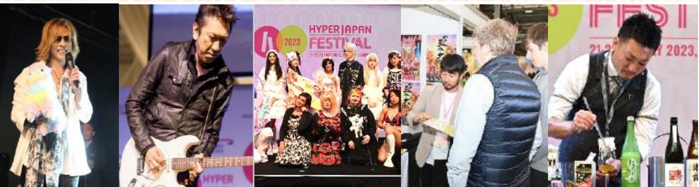
前回迄のHYPER JAPAN 開催風景

The UK's Biggest Celebration of Japanese Culture