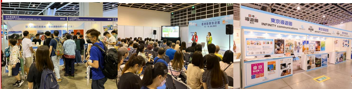
香港ITE “ジャパンTABIゾーン”開催風景

※ブース出展費用につきましては、「正式申込書」受領後にご請求書を発行させていただきます。