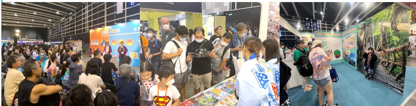
「香港ブックフェア 香港スポーツ&レジャーエキスポ」開催風景

※ 2023年12月29日(金)以降にお申込みの場合でも小間に空きがあればお申込み頂けますが、確実にジャパンパビリオン(TABIゾーン)に出展頂くには調整が必要となります。