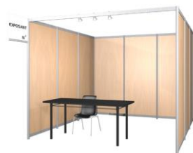
3,000×3,000mm = 9㎡

※ ローズスペース(土間)のみ3,000×3,000mm = 9㎡ 455,000円 (現地VAT含む)。詳細はお問い合わせ下さい。