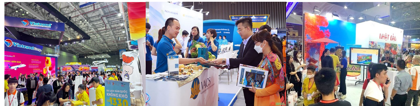
ITE HCMC 過去の開催風景

ITE HCMC2024出展募集のご案内です。出展をご希望の自治体・企業様は、次ページよりお申込み下さい。