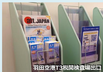
羽田空港T3税関検査場出口