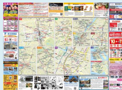
< 紙面 中面 >