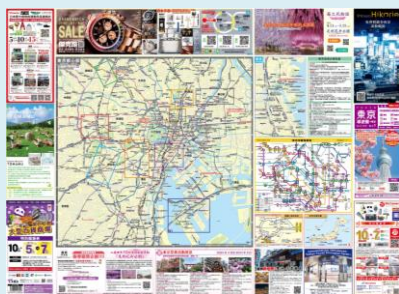
< 紙面 表面 >