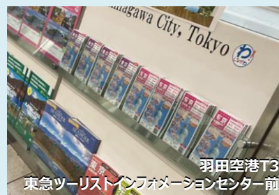
羽田空港T3 東急ツーリストインフォメーションセンター前