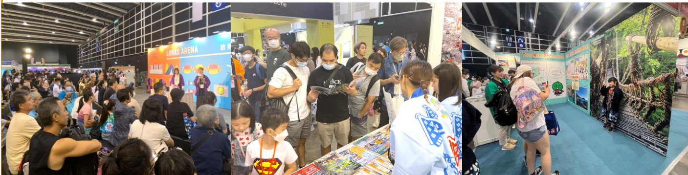
「香港ブックフェア 香港スポーツ&レジャーエキスポ」開催風景

「香港ブックフェア2026 香港スポーツ&レジャーエキスポ ジャパンパビリオン」出展をご希望の自治体・企業様は、 次ページよりお申込み下さい。